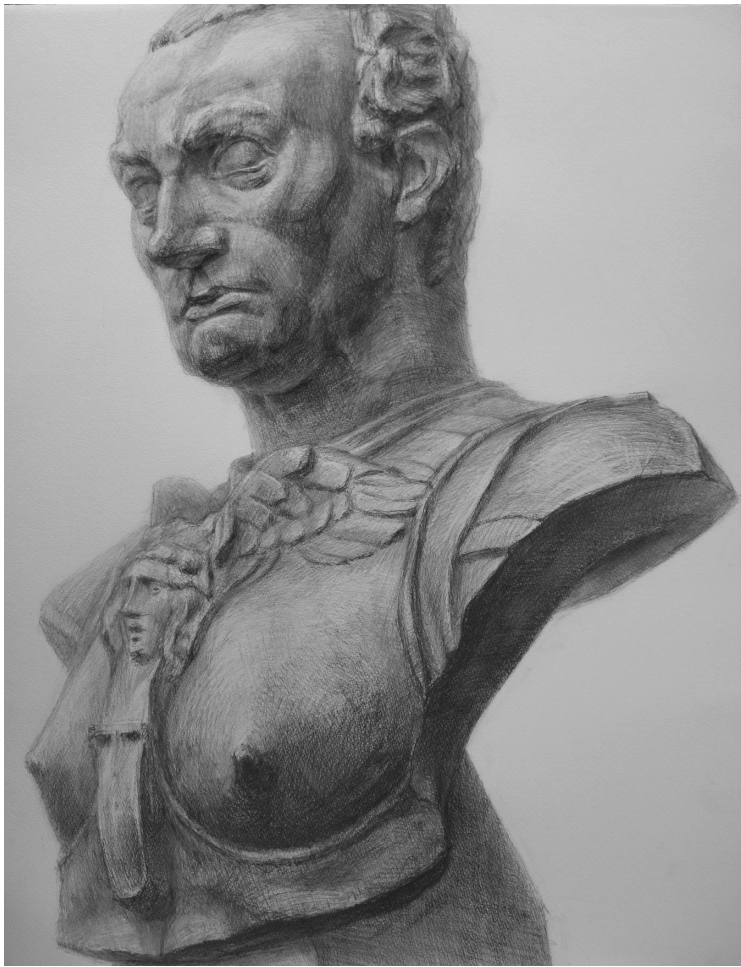
デザインコース 生徒作品