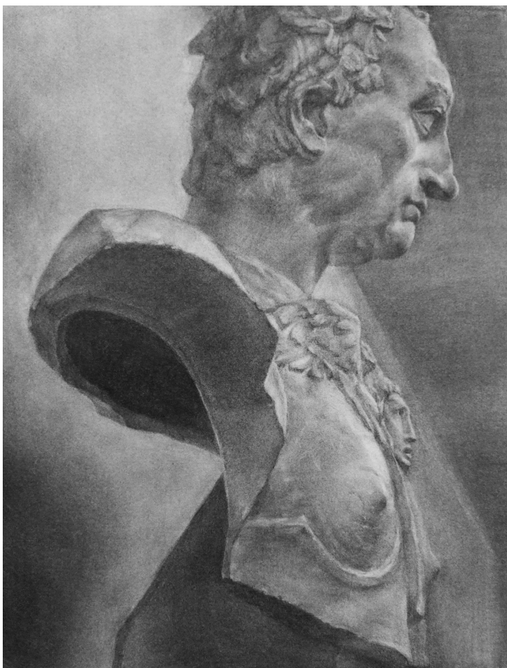
絵画コース 生徒作品